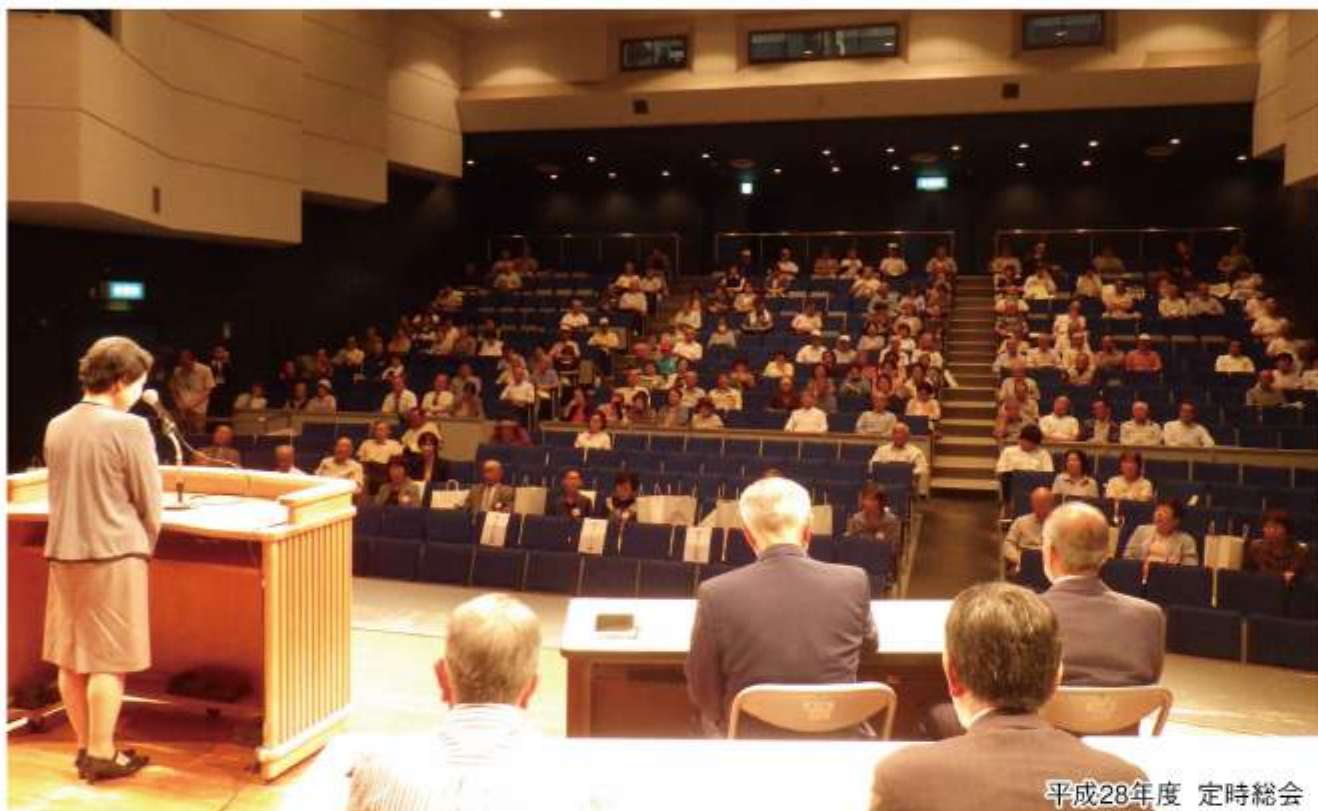
平成28年度 定時総会

公益社団法人 日向市シルバー人材センター 〒893-0021 日向市大字財光寺847番地1 TEL (0982) 52-2200 FAX (0982) 52-3476