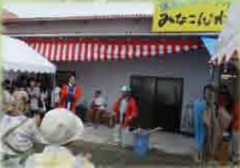
実行委員長のあいさつ