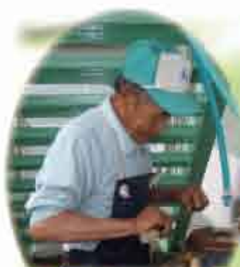
毎回人気の刃物研ぎ