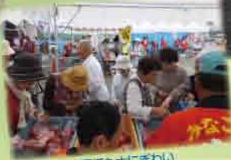
雨でも大にぞわい