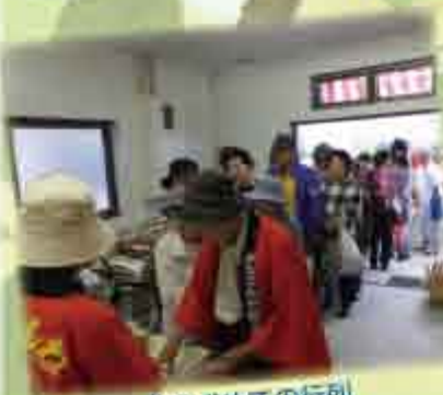
餅を求めての行列